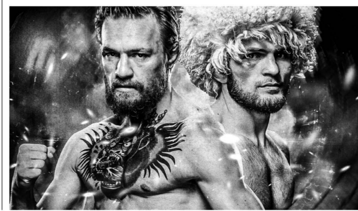
Полную версию материалов читайте на сайте www.dagpravda.ru