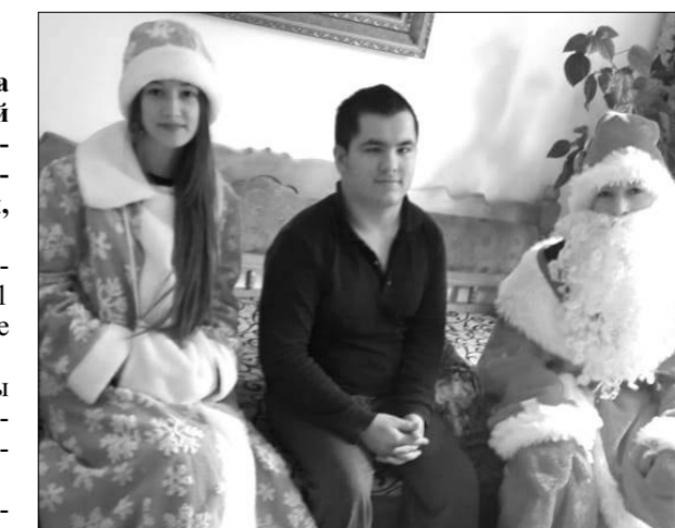
подарки детям-инвалидам, больным ДЦП, которые не

Дети приносят в школу и реализуют разные блюда и печенье изделия. Средства, вырученные в этой акции, были решено использовать на новогодние подарки