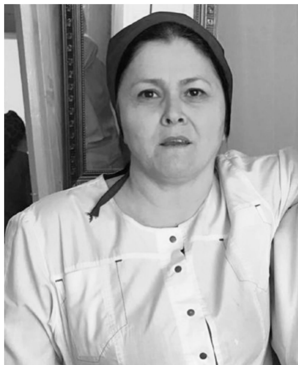
лист. Знает свою работу. Умеет выслушать больного.

Как отмечают больные, она отличная специа-