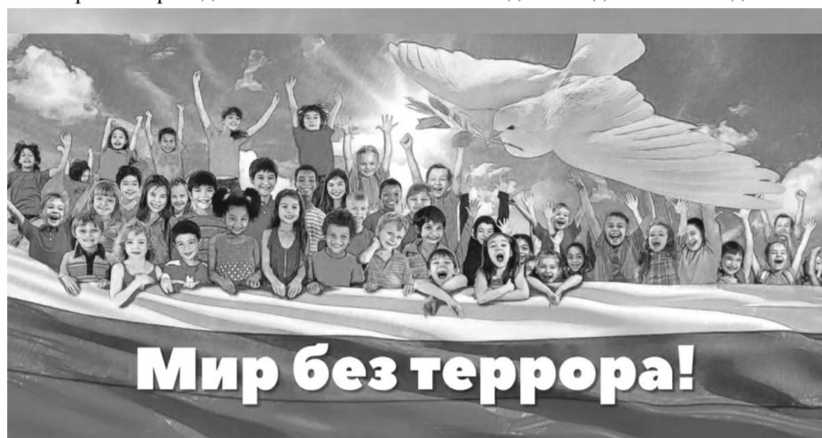
Мир без террора!

мероприятий по формированию правовой культуры в молодежной среде. В частности, этому могло бы способствовать существование расширенного юридического составающей в воспитании и образовании. Знание своих собственных прав и свобод будет способствовать развитию у молодого поколения чувства уважения к правам и свободам других лиц, в том числе к их жизни, здоровью и достоинству.