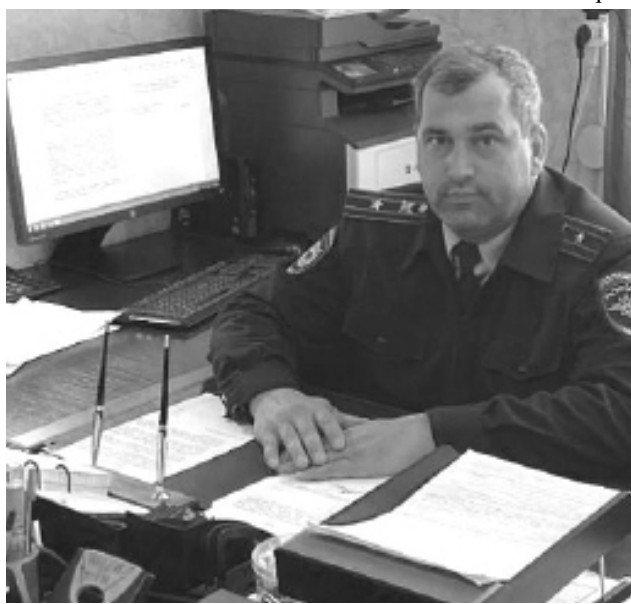
КоАП РФ, вступившем в силу 1 апреля 2020 года (Невыполнение правил поведения при

или наложение административного штрафа на граждан от одной тысячи до тридцати тысяч рублей; на должностных лиц - от десяти до пятидесяти тысяч рублей; на лиц, осуществляющих предпринимательскую деятельность без образования юридического лица, - от тридцати до пятидесяти тысяч рублей и на юридических лиц - от ста до трехсот тысяч рублей. Помните: успешно противодействовать распространению коронавирусной инфекции можно только при ответственном отношении каждого гражданина! Благодарим всех, кто относится с пониманием к сложившимся обстоятельствам и неукоснительно соблюдает введенные ограничительные меры, а также рекомендации медиков.