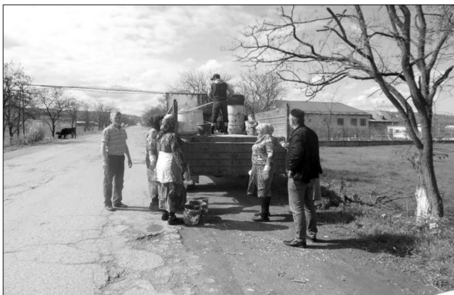
дений, организаций района. К проводимым мероприятиям привлечена и спецтехника, которая вывозит де-