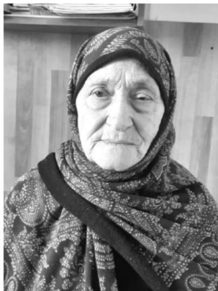
честь для всех, кто имел счастье у нее учиться.