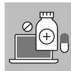
НЕ ЗАНИМАЙТЕСЬ САМОЛЕЧЕНИЕМ