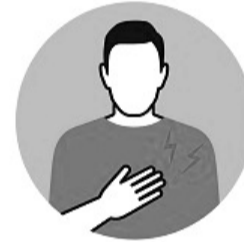
БОЛЬ В МЫШЦАХ