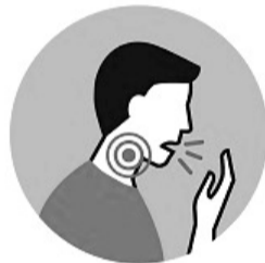
КАШЕЛЬ И/ИЛИ БОЛЬ В ГОРЛЕ