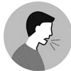
ВОЗДУШНО- КАПЕЛЬНЫЙ ПУТЬ

Через зараженные поверхности – рукопожатия, поручни в транспорте, дверные ручки, другие предметы и поверхности.