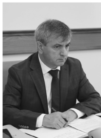
Первый заместитель Председателя Правительства РД Нюсрет Омаров в режиме ВКС провел заседание Комиссии по проведению Всероссийской переписи населения в Дагестане.

Нюсрет Омаров сообщил, что в текущем году в стране будет проведена всероссийская перепись населения. Республика Дагестан является одним из немногих субъектов РФ, где перепись населения пройдет в 2 этапа. Первый этап продлится с 1 по 31 июля текущего года, в рамках которого будет переписано население отдаленных и труднодоступных территорий.