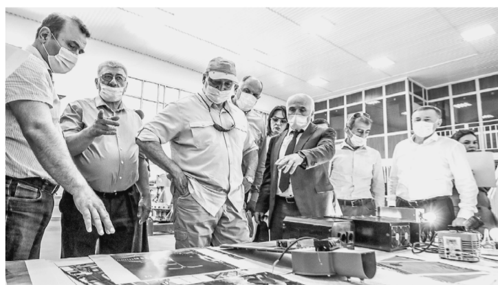
Врио Главы Дагестана Сергей Меликов побывал с рабочей поездкой в северной зоне Дагестана, сообщает пресс-служба Главы РД.

В городе Южно-Сухокумск мероприятия начались с осмотра территории движущихся песков на землях отгонного животноводства в 4 км восточнее поселка Восточно-Сухокумск. В каждом муниципалитете основное внимание уделяется социальным объектам, и Южно-Сухокумск не стал исключением. Здесь руководитель республики осмотрел детский сад «Ромашка», строительство которого уже завершено. Учреждение, рассчитанное на 144 места, начали строить в апреле 2020 года по программе «Сейсмобезопасность». Сергей Меликов пообщался с работниками детского сада, обратив при этом особое внимание на увеличение их зарплат. Руководитель республики подчеркнул, что работники бюджетной сферы должны получать не меньше уровня среднего показателя по экономике в муниципалитете. В этой связи глава региона поручил разобраться в ситуации.