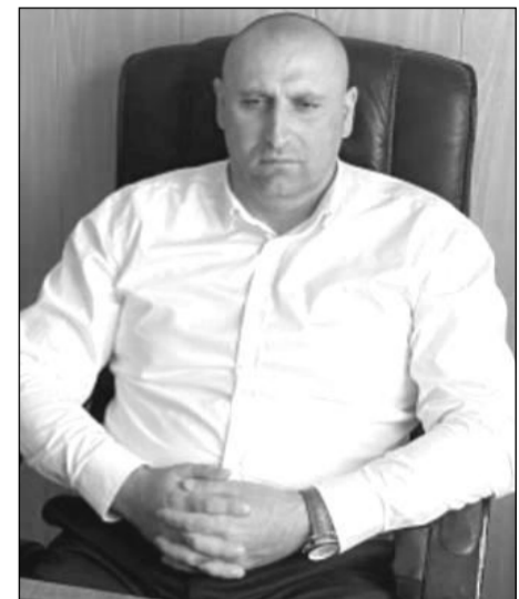
– на преодоление трудной жизненной ситуации посредством прямого материального стимулирования», – сообщил Казиев.

22 июня вице-премьер Дагестана Мурад Казиев провел совещание по вопросу обеспечения реализации прав граждан на государственную помощь на основании социального контракта. Мурад Казиев отметил, что механизм социального контракта – это один из способов борьбы с бедностью.