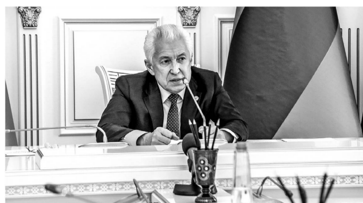
Глава Дагестана Владимир Васильев провёл совещание по вопросу строительства объектов на территории республики в рамках федеральных программ и национальных проектов с привлечением ГВСУ № 4 Минобороны России, сообщает пресс-служба Администрации Главы и Правительства РД.

Во вступительном слове руководителем республики отметил, что выделение значительных финансовых средств из федерального бюджета для решения вопросов, связанных с ликвидацией трехлетнего режима обучения в школах и нехваткой мест в детских дошкольных учреждениях, стало возможным при поддержке Президента РФ и Правительства РФ.