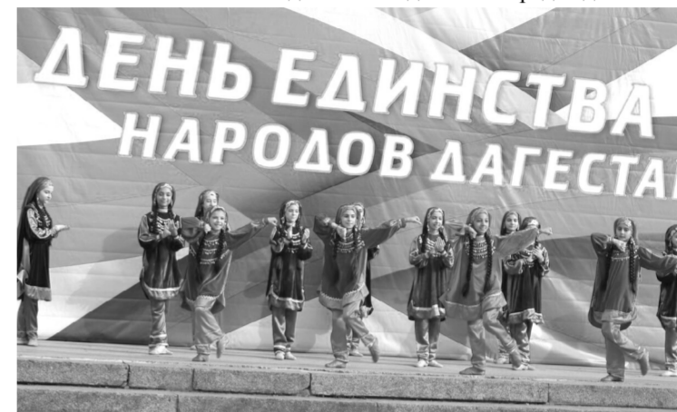
События августа – сентября 1999 года показали единство народов Дагестана перед лицом общего врага, наглядно продемонстрировали желание дагестанцев жить в составе России и защищать свою Родину при необходимости с оружием в руках, сплотившись единым фронтом.

Мы живем в Дагестане, на Кавказе. А здесь люди всегда славились своей мудростью. Мы прежде всего дагестанцы, а потом уже представители своего народа. Мы становимся едиными перед бедой.