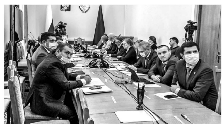
Освоение средств консолидированного бюджета Республики Дагестан, наращивание налогового потенциала муниципальных образований республики и сбор налогов – ключевыми вопросами на совещании, которое провёл Глава Дагестана Владимир Васильев.

Как сообщает пресс-служба Администрации Главы и Правительства РД, в режиме видеоконференции-связи в нём приняли участие представители органов власти разных уровней и главы муниципальных образований.