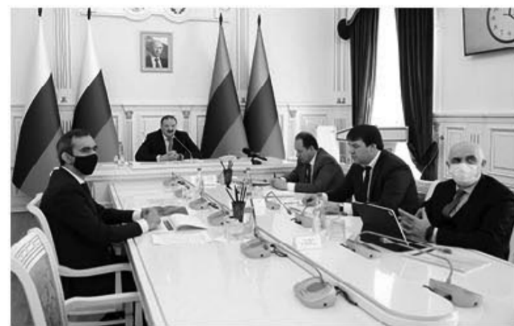
Врио Главы Дагестана Сергей Меликов провел совещание, на котором речь шла о состоянии и перспективах развития туризма в республике, сообщает пресс-служба Главы РД.

Подчеркивая важность обсуждаемого вопроса, руководитель республики отметил, что туризм напрямую влияет на привлекательность Дагестана и на благосостояние его жителей. Поэтому развитие отрасли он назвал одной из важнейших задач на сегодня.