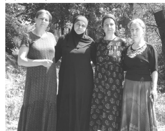
Жители села Тухчар

Забота о стариках — священный долг каждого человека, а эти люди избрали это делом своей жизни. Они показывают свой профессионализм и свое огромное доброе сердце, посвятив свою жизнь помощи людям и нисколько об этом не жалеют. Для них совершать добрые дела — это счастье. Социальные работники районного Центра социального обслуживания трудятся, даря своим пациентам океан добра и теплоты.