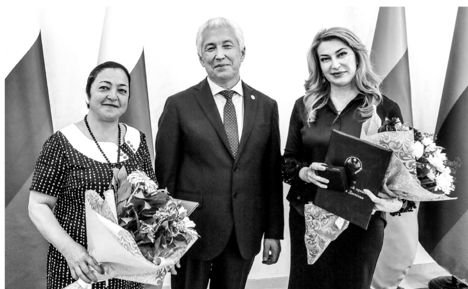
В Доме дружбы Глава Дагестана Владимир Васильев 26 июля в торжественной обстановке вручил государственные награды, Государственные премии Республики Дагестан и премии имени Расула Гамзатова.

Предваряя награждение, Владимир Васильев сказал: «Сегодня важная дата для республики – день, когда был утвержден основополагающий закон Дагестана. Он был принят в сложное время в 2003 году, и те, кто его готовил, хорошо это понимали. Как показывает история, решение было правильным, удалось стабилизировать ситуацию в экономике и социальной сфере, конституционные нормы прочно утвердились в государственном строительстве и общественной жизни. Конституция позволила сохранить единство и целостность республики, закрепила основы демократического устройства, признавая высшей ценностью права и свободы человека, верховенство закона. Этим принципами мы руководствуемся и сегодня, а одной из задач движения в этом направлении, при условии соответствия требованиям закона, является достижение понимания и поддержки нашей работы широкими слоями населения. Мы наводим порядок в таких сферах, как лекарственное обеспечение, медико-санитарная экспертиза, боремся с неэффектив-