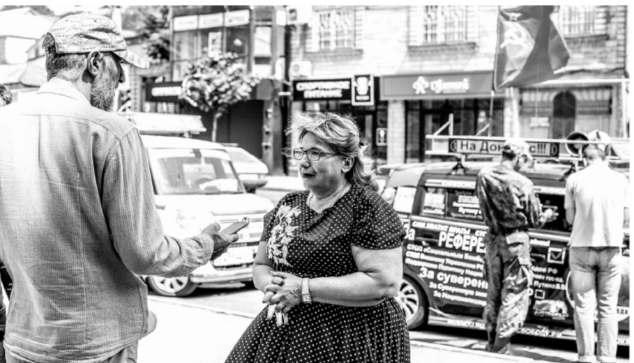
народный референдум». На самом видном месте – портрет Президента России с надписью «Родина. Свобода. Путин». «Мы выехали с территории Донецкой Народной Респуб-