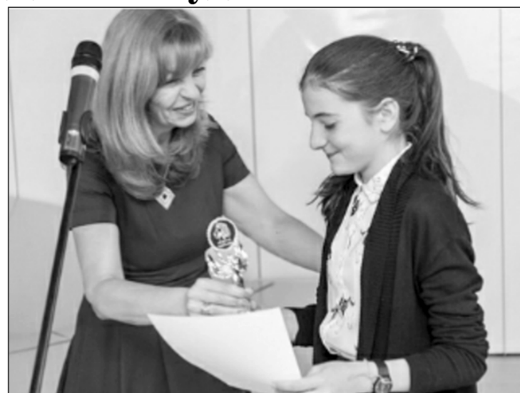
конкурса обширна: от Камчат-

Участие в конкурсе ежегодно принимают тысячи ребят со всей России. География