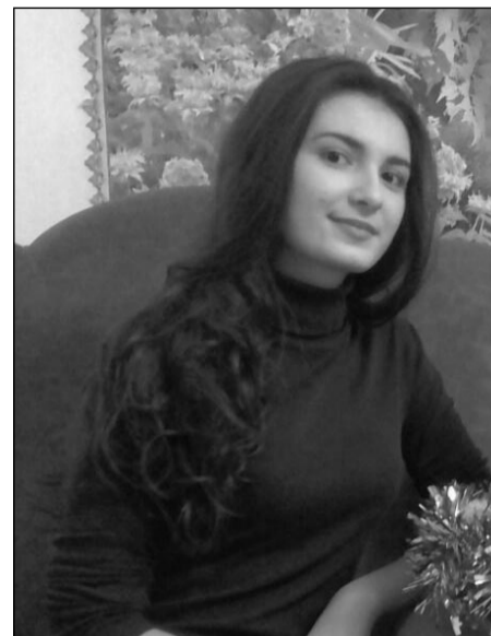
во всех делах!