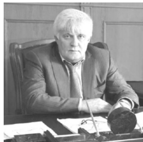
Администрация Новолакского муниципалитета создала резервный фонд помощи нуждающимся жителям и учреждениям района.

Напомним, что ранее райадминистрацией, главами сельских поселений, образовательными организациями при содействии меценатов, роздано