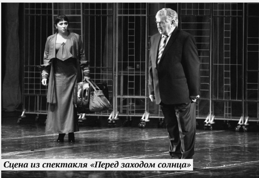
Сцена из спектакля «Перед заходом солнца»